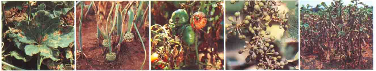
ჭრაქით, ფიტოფტოროზით და ალტერნარიოზით დაავადებული კულტურები